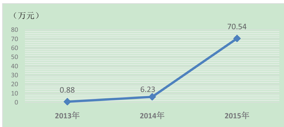
图 2-1 学院支付企业兼职教师课酬